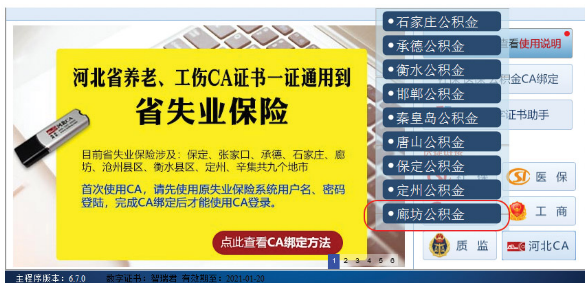
河北CA数字证书助手界面

打开河北CA数字证书助手，点击“公积金”，选择邯郸公积金，或在浏览器地址栏中输入邯郸住房公积金网上业务大厅（网址 http://wt.lfzfgjj.net:12329/ish ）进入网上营业大厅，如下图：